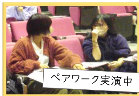
ペアワーク実演中

認知症=高齢者と思っていたが、 若年性認知症もあると知り、尚更 認知症は 誰にでも 起こり得るもの ということが理解出来た。