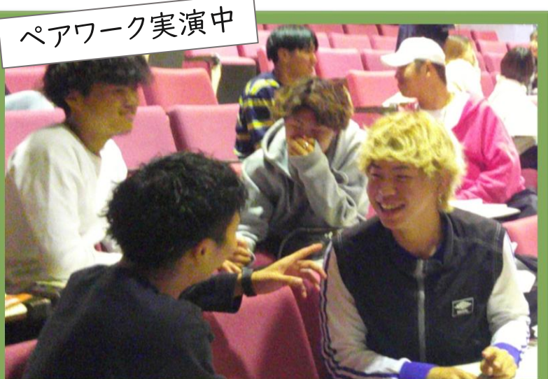
ペアワーク実演中